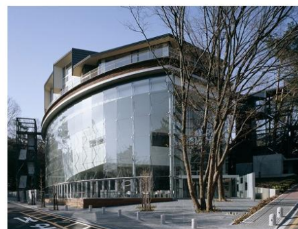
名古屋大学野依記念学術交流館（会場は2階です）